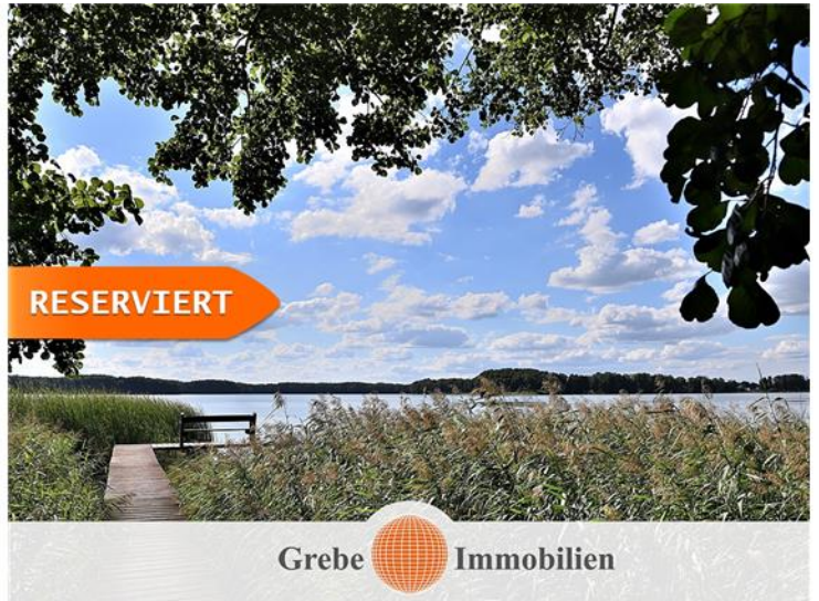
ein Tag im Sommer