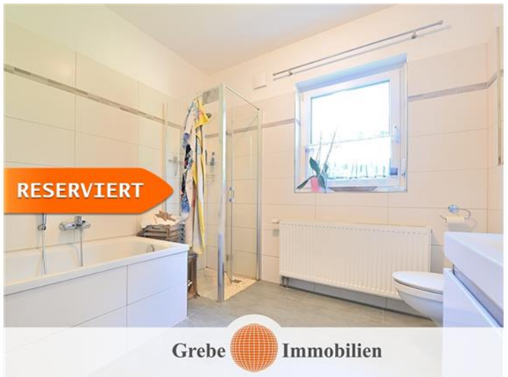
Bad mit Fenster, Wanne und Dusche