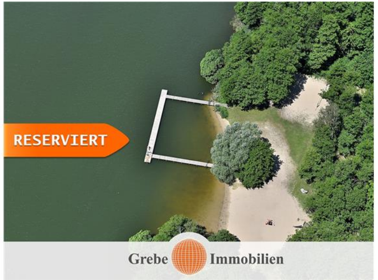
Badestelle am Wünsdorfer See