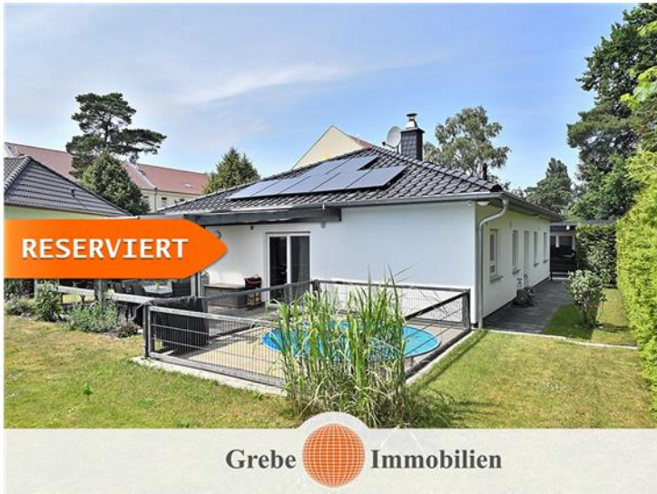
Pool direkt am Haus