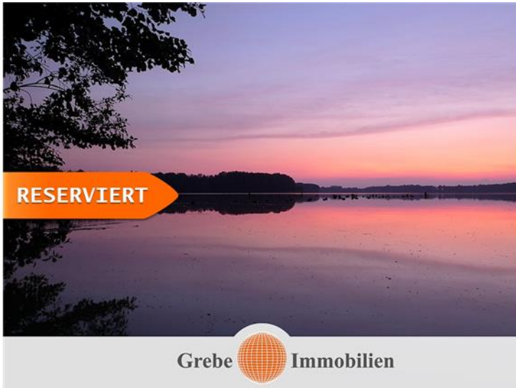
Abend am Wünsdorfer See