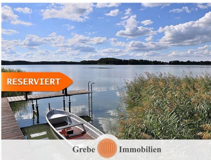
Ruhe am Wasser