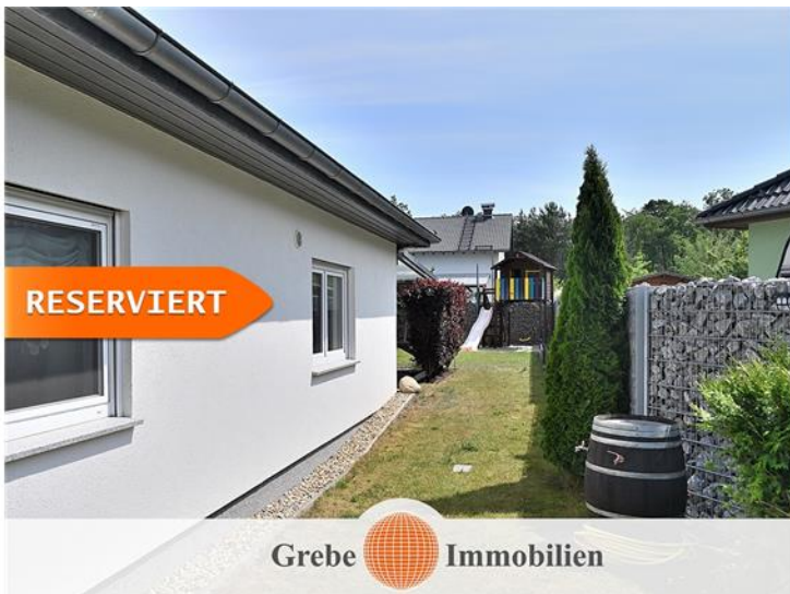
neben dem Haus