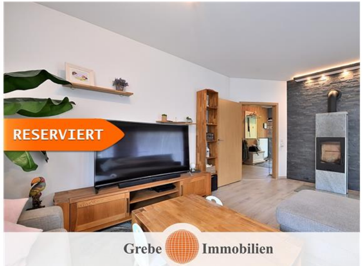
Kamin im Wohnzimmer