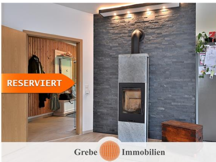
Gemütlichkeit im Winter