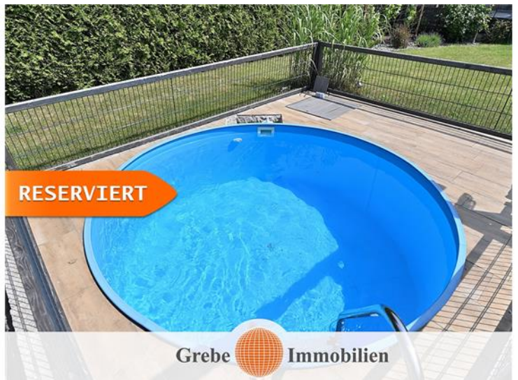
Blick in den Pool