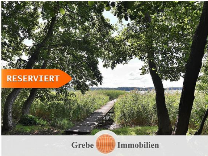
Weg zum Wasser