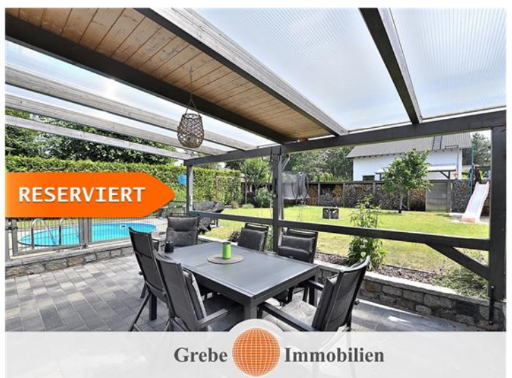
Terrasse und Pool