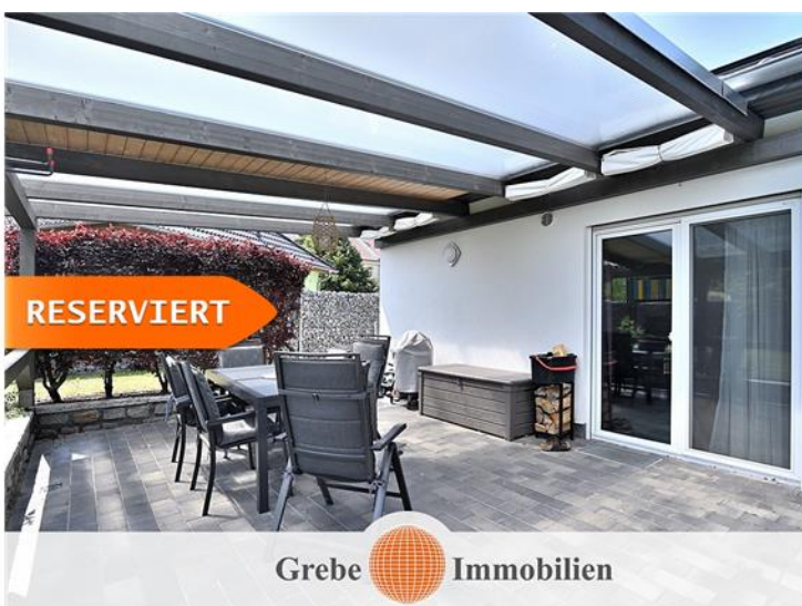
Terrasse direkt am Haus