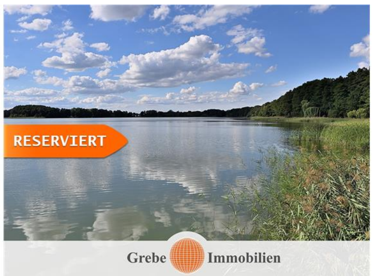
Blick über den See