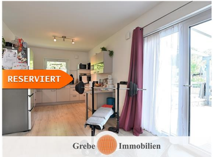
Zugang zur Terrasse