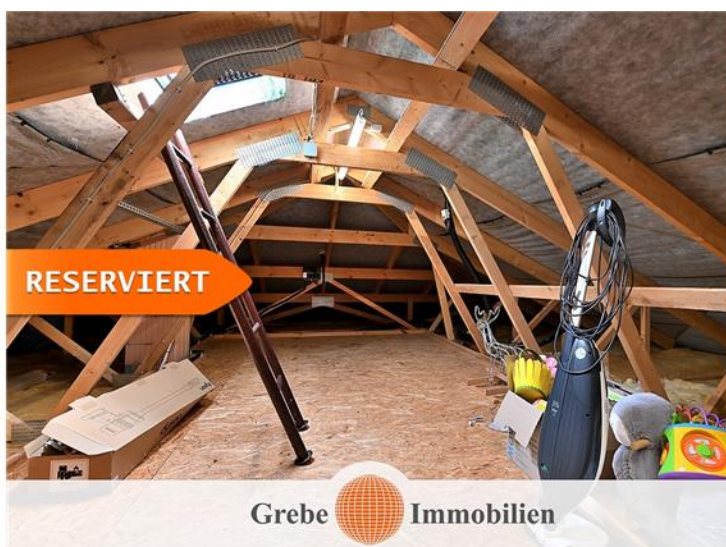
Stauraum auf dem Dach