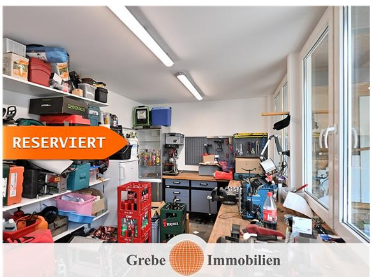
viel Platz im Nebenglass